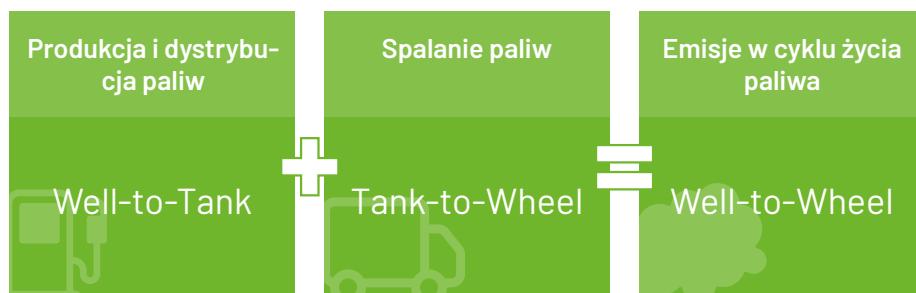
Cykl życia paliwa

Wielu klientów wymaga od swoich dostawców usług transportowych kompleksowego raportowania emisji CO 2 . Tworzenie takiego systemu raportowania często wymaga wielu ręcznych działań, co kosztuje dużo czasu.